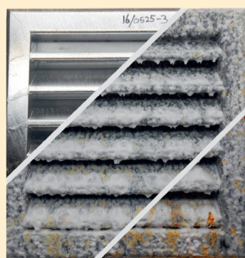
Volbadverzinkt na 0, 500 en 1500 uur blootstelling aan zoutnevel