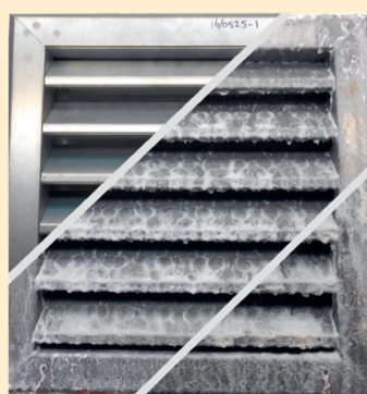
Magnelis na 0, 500 en 1500 uur blootstelling aan zoutnevel