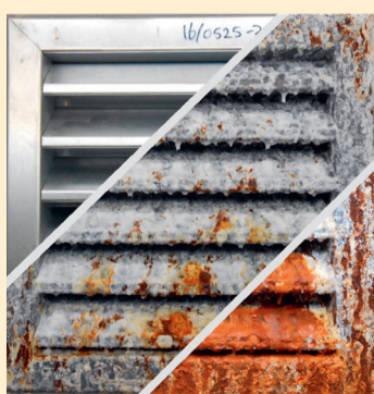
Sendzimir na 0, 500 en 1500 uur blootstelling aan zoutnevel

Vanwege deze positieve resultaten biedt Interland Techniek de serie IT690 roosters enkel nog aan als Magnelis-uitvoering. Ook Inatherm heeft gekozen om verschillende luchtappendages voortaan te voorzien van deze nieuwe metallische staalbekleding.